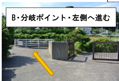
B・分岐ポイント・左側へ進む