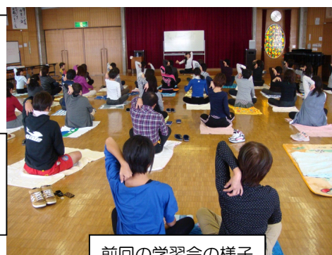
前回の学習会の様子

※本会への参加を希望される方の申し込みを会場で受け付けます。会員になられた方には定期的にご案内を送付させていただきます。